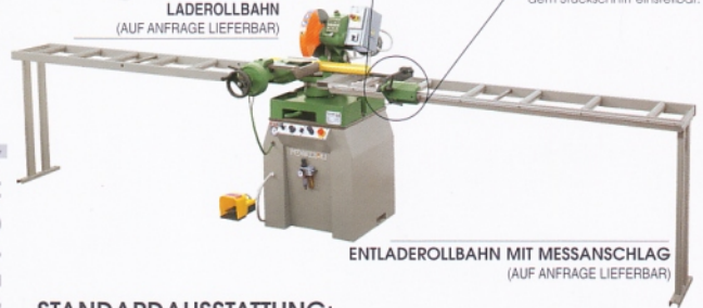
ENTLADEROLLBAHN MIT MESSANSCHLAG (AUF ANFRAGE LIEFERBAR)