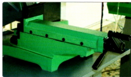
Spannstock mit einstellbarer Leiste