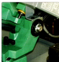
Exzenter für Einstellung der senkrechte Stellung vom Bügel