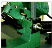
Exzenter für Einstellung der senkrechte Stellung vom Bügel

(*) Spannstocksultern können nach hinten verstellt werden so dass die max. Schnittka- pazität (340 x 180 mm) erreicht wird, Eingek- erbte Mass-Skala mit einfacher Ablesung