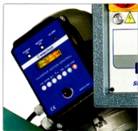
Elektronische Schnittgeschwindigkeitsvariator für Sägeblatt