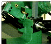
Exzenter für Einstellung der senkrechte Stellung vom Biegel