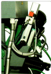
Hydraulische Zylindergruppe für Biegelbewegung