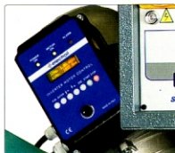
Elektronische Schnittgeschwindigkeitsvariator für Sägeblatt